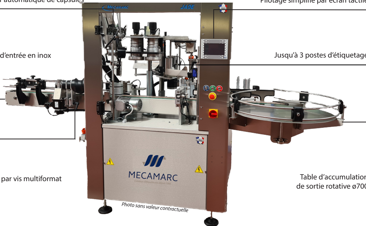
Table d'accumulation de sortie rotative ø700